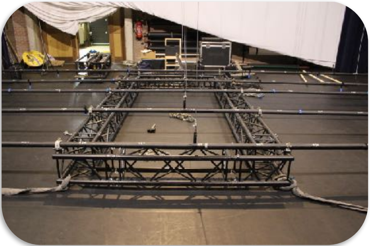
OPTION 1: The truss frame, directly attached to the fly system of the theatre.